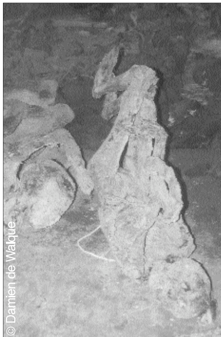
Comment oublier l'horreur ?

pays, soit à l'extérieur. Nombreux sont les personnes qui ont mené pendant des mois, parfois même des années une vie tout à fait indécente, une vie sans le minimum des conditions humaines : nourriture suffisante, logement décent, éducation, ... Ça fait mal de voir les souffrances dans les yeux de nombreuses personnes, de voir les cicatrices sur la tête des jeunes, des membres coupés, les effets des coups de machettes. C'est l'individu qui souffre, ce sont les divers groupes qui souffrent, c'est toute la société qui est bouleversée, les déchirures sont profondes.