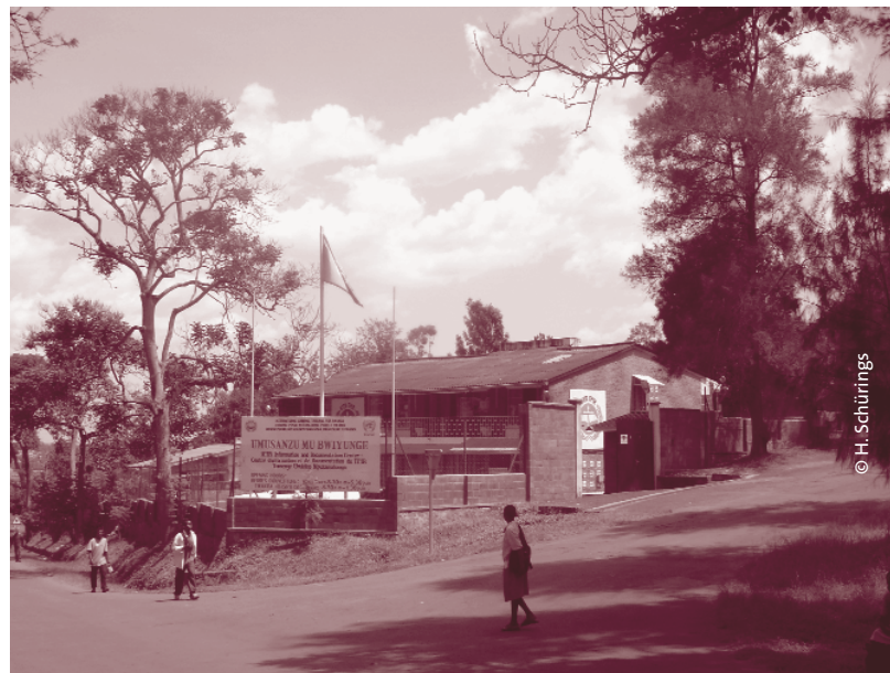
Kigali-Büro des Internationalen Strafgerichtshofs für Ruanda (ICTR)

Ebenso war die Presse- und Meinungsfreiheit von dieser Entwicklung betroffen, nachdem ein striktes Pressegesetz laut „Reporter ohne Grenzen“ im Jahr 2002 den Spielraum für Journalisten stark eingeschränkt hatte. Betroffen von dieser Entwicklung