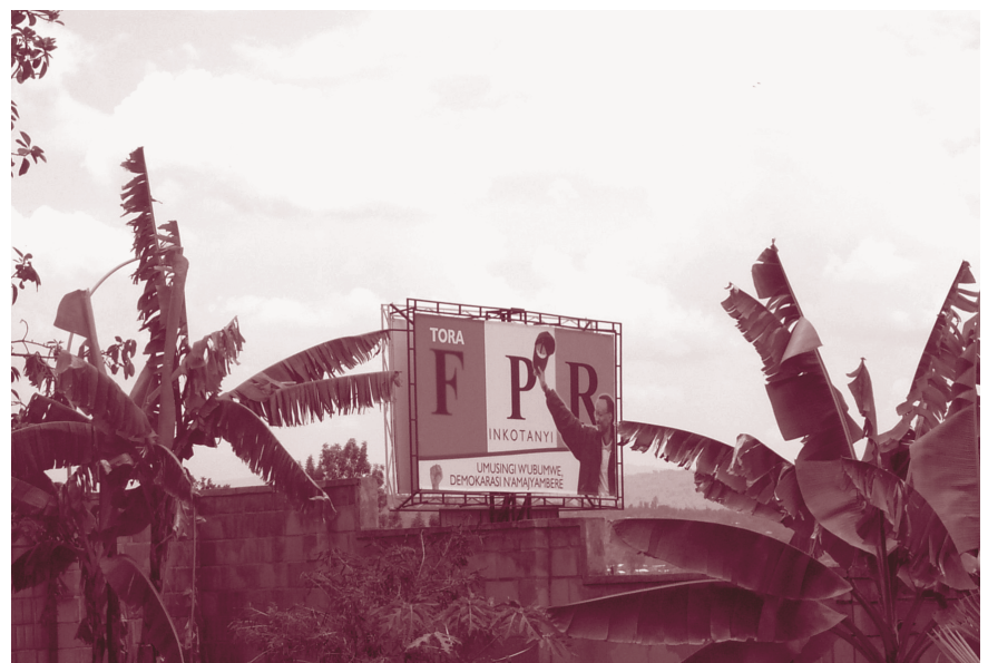
Präsidentenwahlen 2003, Paul Kagame wird mit großer Mehrheit gewählt.

Es steht außer Frage, dass die Weltgemeinschaft den Genozid hätte verhindern können – hätte sie den notwendigen Willen dazu aufgebracht. Internationale und nationale Kommissionen haben dieses Versagen untersucht und dabei unterschiedliche Aspekte beleuchtet. Während der UN-Bericht der Carlsson-Kommission von 1999 ein besonderes Augenmerk auf die Rolle der UN legte und Kofi Annan eine schwere Verantwortung zuwies, indem er ihn beschuldigte, den Sicherheitsrat nicht angemessen informiert zu haben, hebt der Masire-Bericht der OAU aus dem Jahr 2000 stärker die Verantwortung der katholischen und anglikanischen Kirche sowie einzelner Staaten hervor. So habe Frankreich seinen Einfluss und die engen Verbindungen zum Regime nicht genutzt, um den Völkermord zu verhindern, und die USA haben innerhalb des Sicherheitsrats ein energisches Vorgehen blockiert. Doch auch afrikanische Staaten hätten sich angesichts des Völkermords auf ihrem Kontinent stärker engagieren müssen. Leider herrschte innerhalb der OAU damals noch das Prinzip der Nichteinmischung, das die Nachfolgeorganisation Afrikanische Union abschaffte.