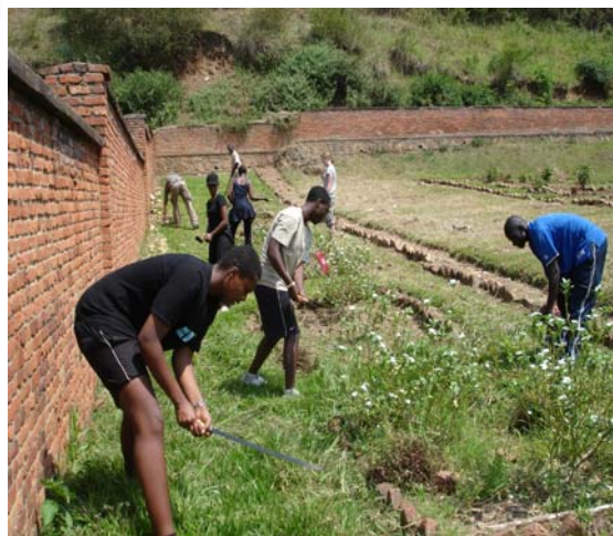
■ Entretien d'une tombe commune/ Pflege eines Massengrabes in Kibuye